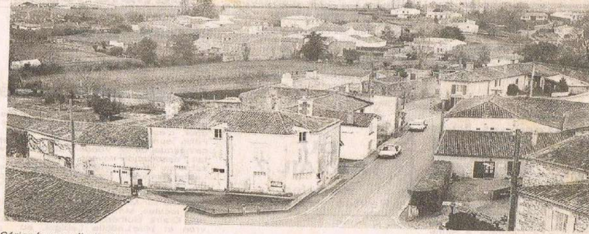
Sérigné sous l'œil du coq